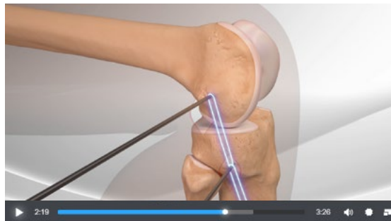
Arthrex - Reconstrucción del Ligamento Anterolateral

Los desgarros del ligamento cruzado anterior (LCA) se encuentran entre las lesiones de rodilla más comunes y se han descrito múltiples técnicas reconstructivas. Sin embargo, los estudios informan con frecuencia una incapacidad para duplicar la función nativa y dinámica de la rodilla, particularmente en rotación. Esta laxitud articular residual que ocasionalmente sigue a una reconstrucción del LCA puede causar más problemas después de la intervención quirúrgica, incluidos desgarros de menisco y, en especial, cambios osteoartríticos tardíos. Además, los nuevos desgarros del injerto de LCA son una preocupación, particularmente en pacientes jóvenes. Aunque estas secuelas no deseadas de la reconstrucción del LCA podrían ser un subproducto de métodos de reconstrucción del LCA insuficientes relacionados con la colocación del injerto o problemas con la curación y la biología del injerto, también es posible que la falta de tratamiento adicional de las estructuras extraarticulares laterales después de la lesión del LCA podría jugar un papel importante. un papel en la laxitud residual de la rodilla afectada. El propósito de este artículo es mostrar una técnica mínimamente invasiva para la reconstrucción del ligamento anterolateral extraarticular.