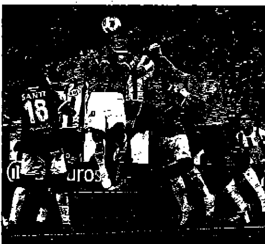
El portero brasileño siempre ofrece espectáculo. (WVO)

Cuando a la vuelta de Málaga se le preguntó sobre el destacado protagonismo que está teniendo en su equipo, el meta chileno contestó que “tiene sus cosas buenas y sus cosas malas. En lo personal puede ser bueno, pero en lo grupal no tanto porque cuando el portero actúa mucho es porque pasan cosas y porque algo está ocur-