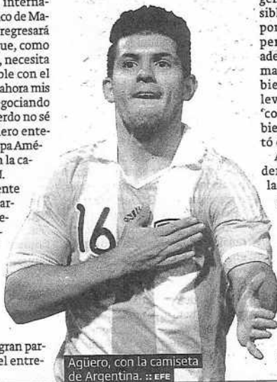
Agüero, con la camiseta de Argentina.

A continuación, con dos goles, se encuentran el colombiano Radamel Falcao García, el peruano Paolo Guerrero y el uruguayo Álvaro Pereira.