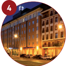
4 Hotel Tryp León 4* Obispo Vilaplana, 3-5 24008 León