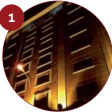
1 Hotel Quindós 3* Gran Vía San Marcos, 38 24002 León