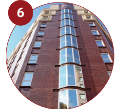
6 Eurostars León 4* Velázquez, 18 24005 León