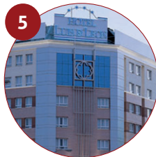
5 Hotel Silken Luis de León 4* C/ de Fray Luis de León, 26 24005 León