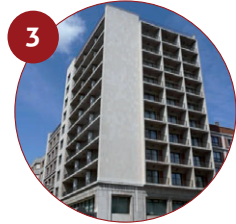
3 Hotel Conde Luna 4* Avenida Independencia, 7 24003 León