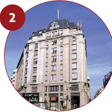
2 Hotel Sercotel Alfonso V 4* Avenida Padre Isla, 1 24002 León